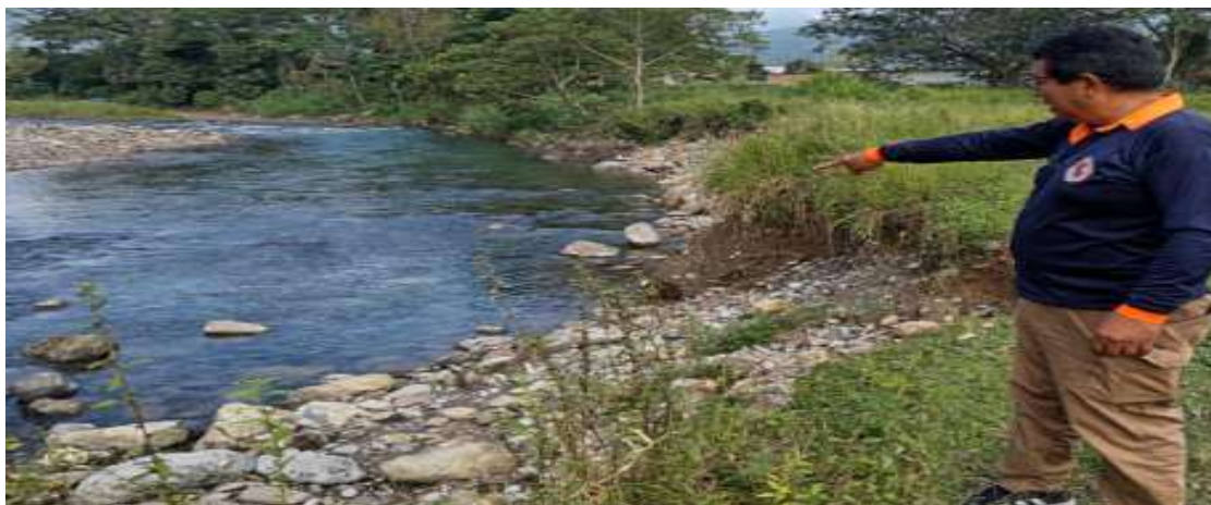
FIGURA N° 04: TRAMO CRÍTICO EN EL RÍO YURACYACU, MARGEN IZQUIERDA, EN EL SECTOR LOS OLIVOS