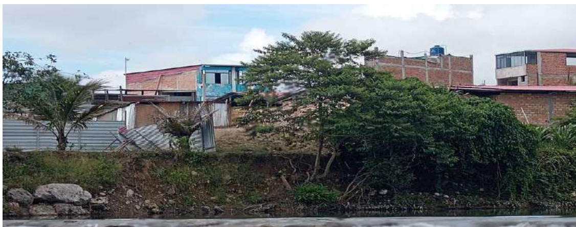
FIGURA N° 02: TRAMO CRÍTICO EN EL RÍO YURACYACU , MARGEN DERECHA, EN EL SECTOR MONTERREY