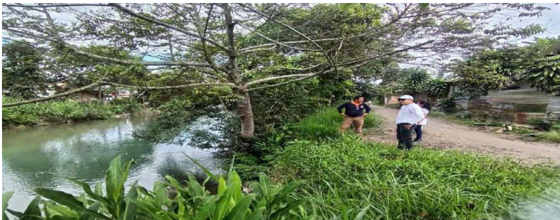
FIGURA N° 01: TRAMO CRÍTICO EN EL RÍO YURACYACU , MARGEN IZQUIERDA, EN EL SECTOR MONTERREY