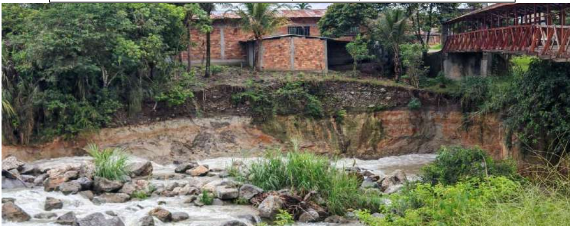
FIGURA N° 03: TRAMO CRÍTICO EN EL RÍO YURACYACU , EN LA CUAL SE OBSERVA EROSION DE LA RIBERA, EN EL SECTOR LOS OLIVOS